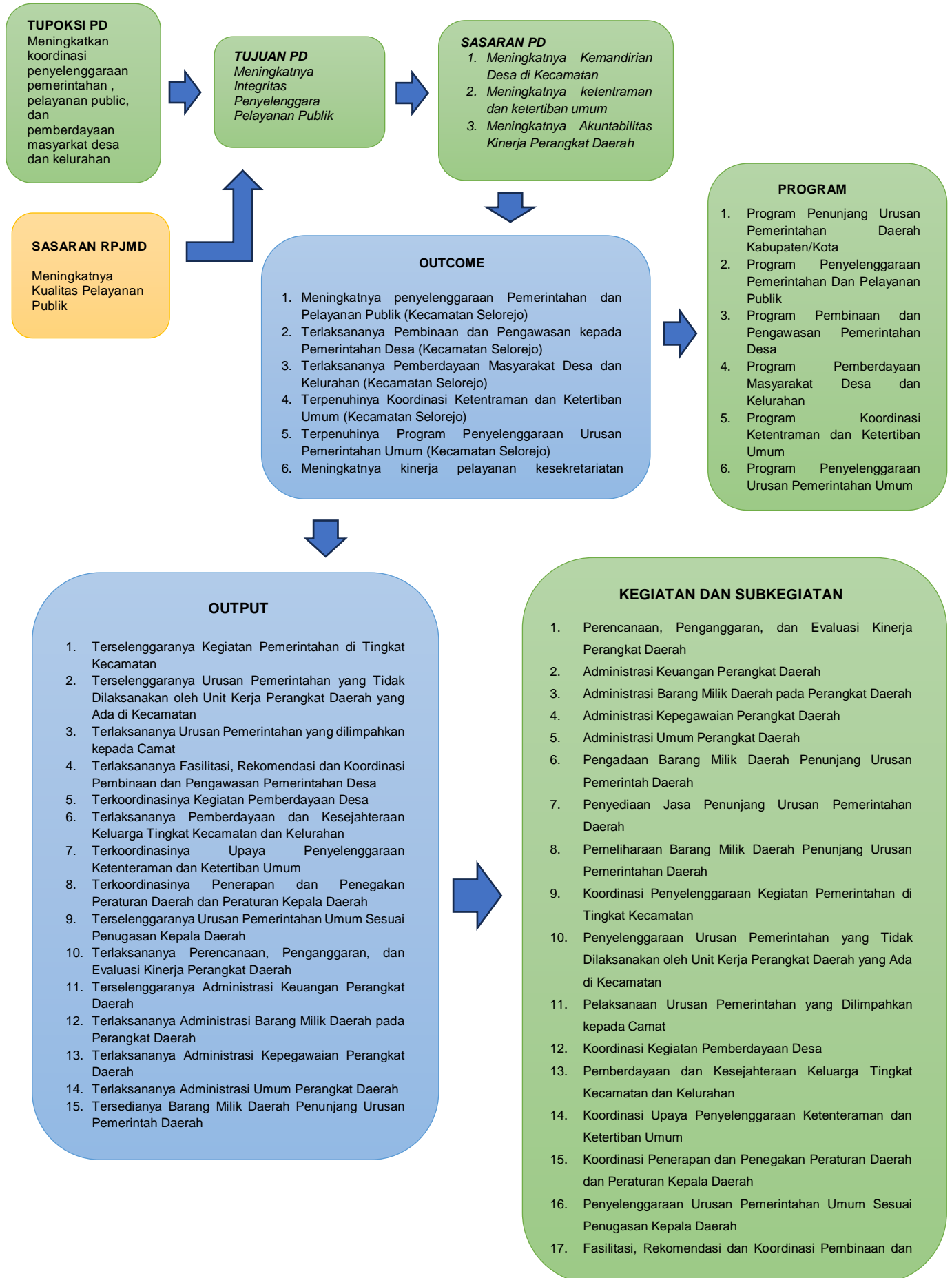
Gambar 4.1: Kerangka Perumusan Program/Kegiatan/Subkegiatan Renstra PD

Adapun Kerangka Perumusan Program/Kegiatan/Subkegiatan Renstra PD dapat dilihat pada Gambar di bawah ini: